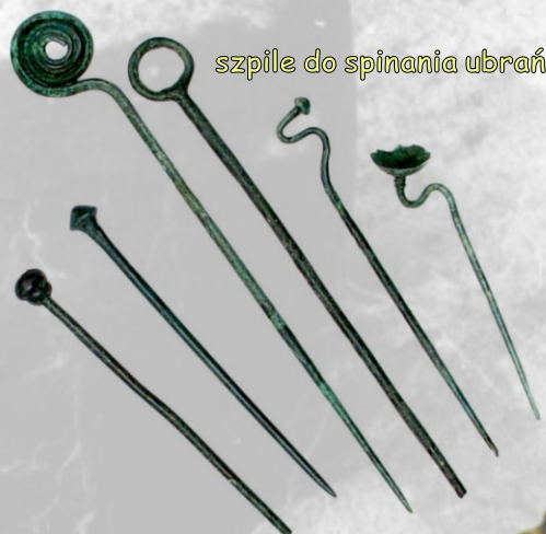
szpile do spinania ubrań