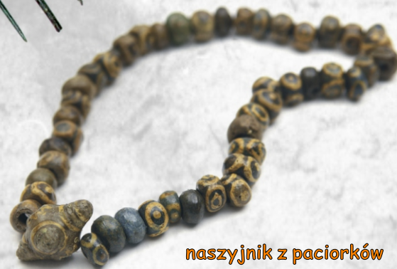
naszyjnik z paciorków