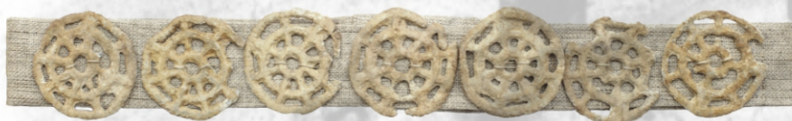
diadem z krążków zakładany na głowę

W trakcie wykopalisk na cmentarzysku w Świbiu odkryto, że pochowanym tu ludziom wkładano do grobów wiele różnych przedmiotów, takich jak naczynia z pożywnieniem, ozdoby z różnych metali, a czasem broń i narzędzia.