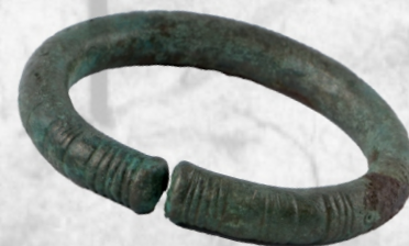
bransoleta na rękę