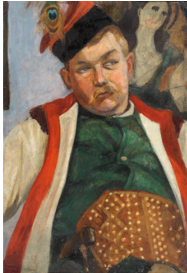
Czepiec z Weselo, ok. 1911, olej na tekturze. Kolekcja prywatna