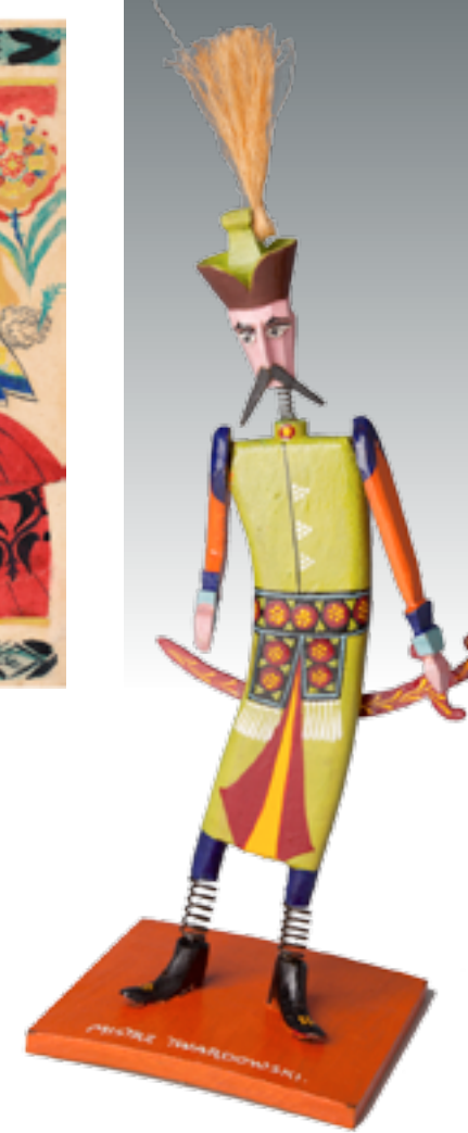
Pan Twardowski, 1928, drewno, metal. Projekt i dekoracja malarska Zofii Stryjeńskiej, wykonanie Józefa Kogut. Muzeum Etnograficzne im. Seweryna Udzieli w Krakowie