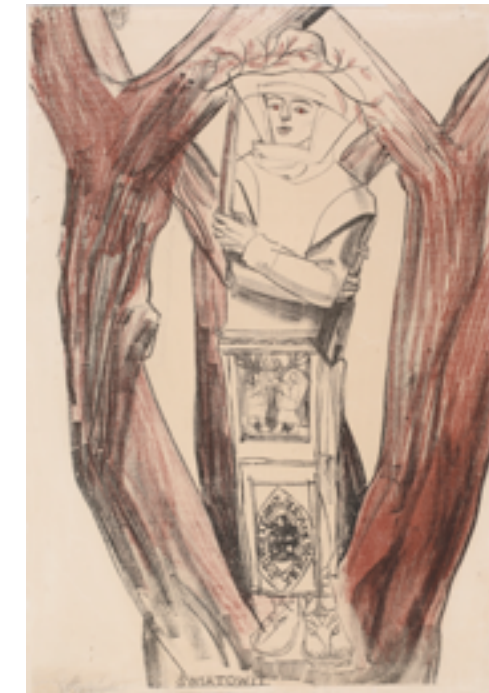
Świątowi, 1918 z teki. Zofia Stryjeńska. Bożki słowiańskie . Kraków – Warsztaty Krakowskie, 1918. Litografia. Jedna z 10 odbitek odbitych na papierze czerpanym i podpisanych przez autorkę. Kolekcja prywatna

ZOFIA STRYJEŃSKA (1891–1976) była w okresie dwudziestolecia międzywojennego artystką sławną i popularną. Dzięki niezwykłemu, jak na lata 20. i 30. XX wieku, masowemu rozpowszechnianiu jej dzieł na różnego rodzaju reprodukcjach – od ekskluzywnych wydawnictw albumowych, przez tablice szkolne, kalendarze, karty pocztowe, po reklamy i plakaty – wiele z nich zdołało się utrwalić w świadomości szerokiego grona odbiorców. Bezprecedensowym sukcesem artystki, który przyniósł jej sławę, była dekoracja ogromnymi obrazami Pory roku wnętrza Pawilonu Polskiego na Międzynarodowej Wystawie Sztuki Dekoracyjnej i Przemysłu Artystycznego w Paryżu w 1925 r. Otrzymała na niej grand prix w czterech działach (malarstwo, plakat, ilustracje, tkaniny) oraz diplôme d'honneur w dziale zabawkarskim. Została też odznaczona Krzyżem Kawalerskim Legii Honorowej.