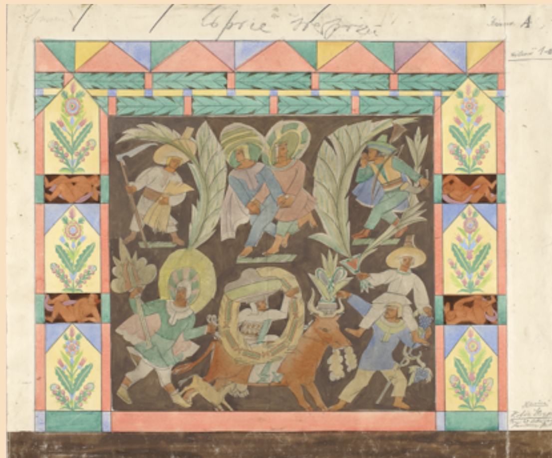
Projekt obrazu Lipiec – sierpień (Dekoracja Pawilonu Polskiego na Wystawie Sztuki Dekoracyjnej i Przemysłu Współczesnego w Paryżu), 1924, akwarela, gwasz, ołówki na papierze. Muzeum Narodowe w Warszawie