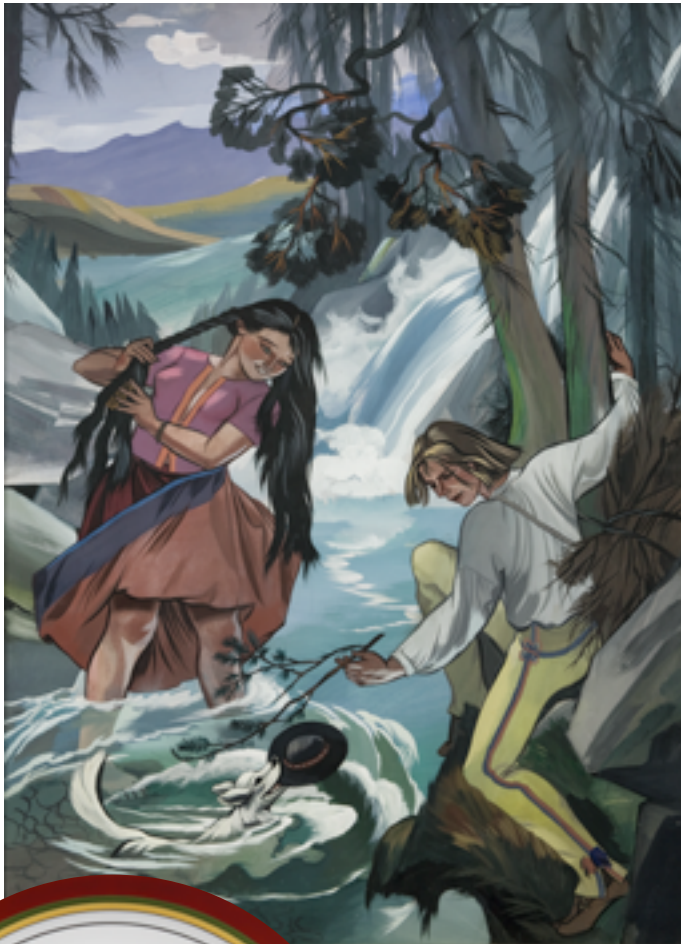
Scena rodzajowa, po 1930, gwasz na papierze. Muzeum Narodowe w Krakowie