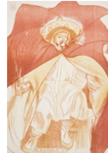
Kupała (Słorice), z teki Bożki słowiańskie, 1918, litografia na papierze. Muzeum Narodowe w Krakowie