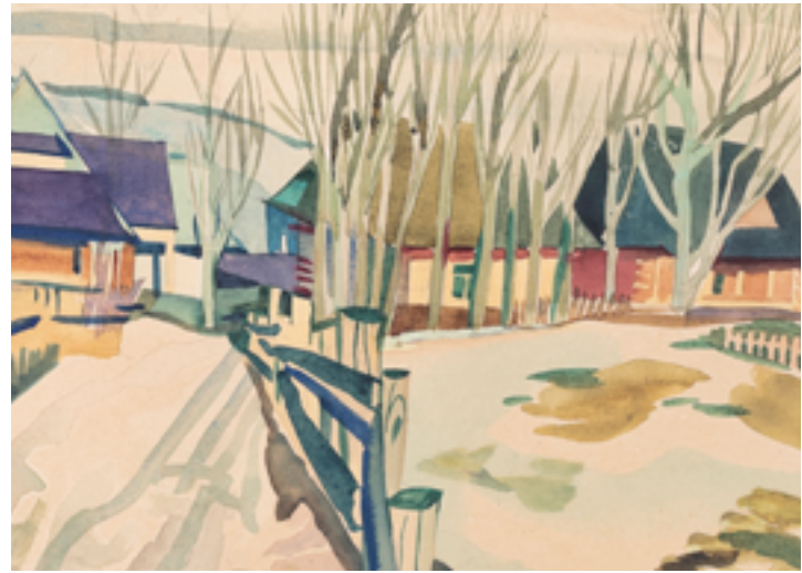
Widok z Gubałówki, 1918, akwarela na papierze. Kolekcja prywatna

Patera Oberek , porcelana, Cmielów, Muzeum w Gliwicach