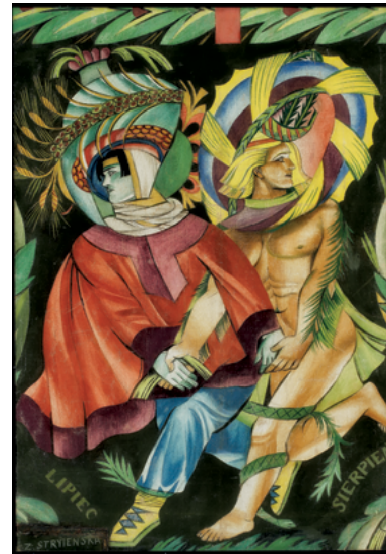
Personifikacje miesięcy (Dekoracja Pawilonu Polskiego na Wystawie Sztuki Dekoracyjnej i Przemysłu Współczesnego w Paryżu) – fragment górnej partii obrazu Lipiec – sierpień, 1924, gwasz, kazeina na płótnie. Muzeum Narodowe w Warszawie