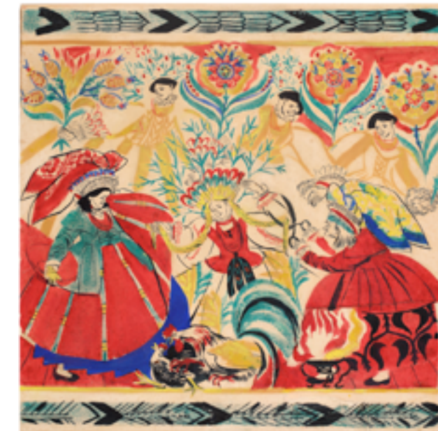
Postrzyżyny, ok. 1914, gwasz, akwarela na papierze. Kolekcja prywatna