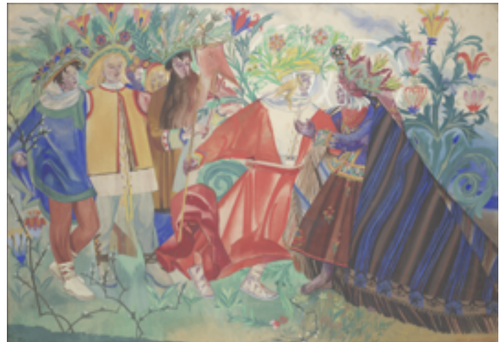
Spotkanie z Synem z cyklu „Pascha”, 1917, akwarela, gwasz na papierze. Muzeum Narodowe w Warszawie