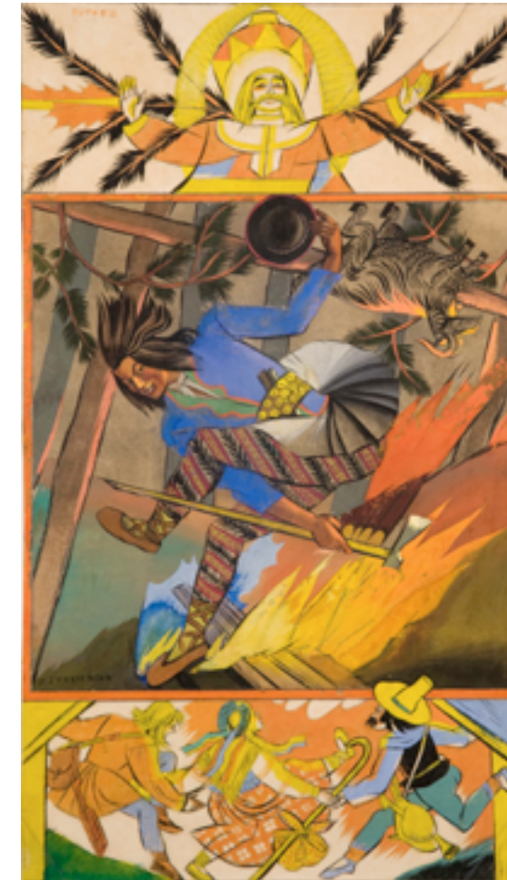
Sobótka – projekt planszy do teki Zofia Stryjeńska. Gusta Słowian. Kompozycje barwne, ozdoby i tekst Zofii Stryjeńskiej. Wydał Jakub Mortkowicz [1934], ok. 1933, akwarela, gwasz, ołówek, tusz na papierze. Kolekcja prywatna