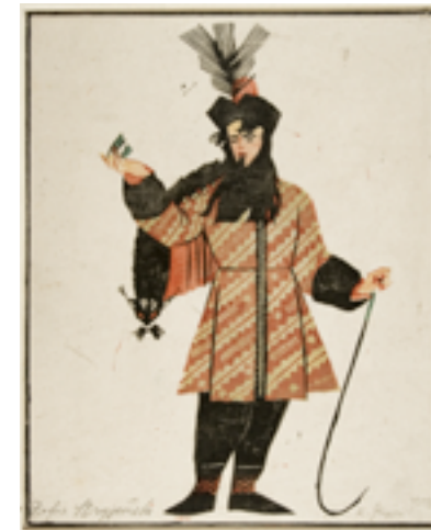
Bożek, 1919, drzeworyt sztorcowy na papierze wykonany wspólnie z Karolem Stryjeńskim. Muzeum Narodowe w Krakowie

Początek drogi artystycznej Zofii Stryjeńskiej, z domu Lubańskiej, wiąże się z zapisaniem jej w 1909 r. do Szkoły Sztuk Pięknych dla Kobiet Marii Niedzielskiej w rodzinnym Krakowie. Następnie, posługując się dokumentami brata i występując w męskim przebraniu, spędziła niezwykle rok w akademii monachijskiej. Z pobytu w Monachium, gdzie zetknęła się ze środowiskiem awangardzistów zainteresowanych zagadnieniami baletu i tańca, wyniosła widoczne w jej późniejszych pracach umiłowanie rytmu. Przedstawiane dotąd realistycznie postacie zaczęły „tańczyć” w korowodach, parach, czasem samotnie. Wtedy narodziła się owa niezwykła muzyczność stanowiąca o sile oddziaływania jej malarstwa.