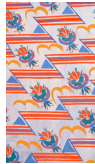
Lubelskie – projekt tkaniny z teki „Tekstyla polskie”, gwasz na papierze. Biblioteka Główna ASP w Krakowie