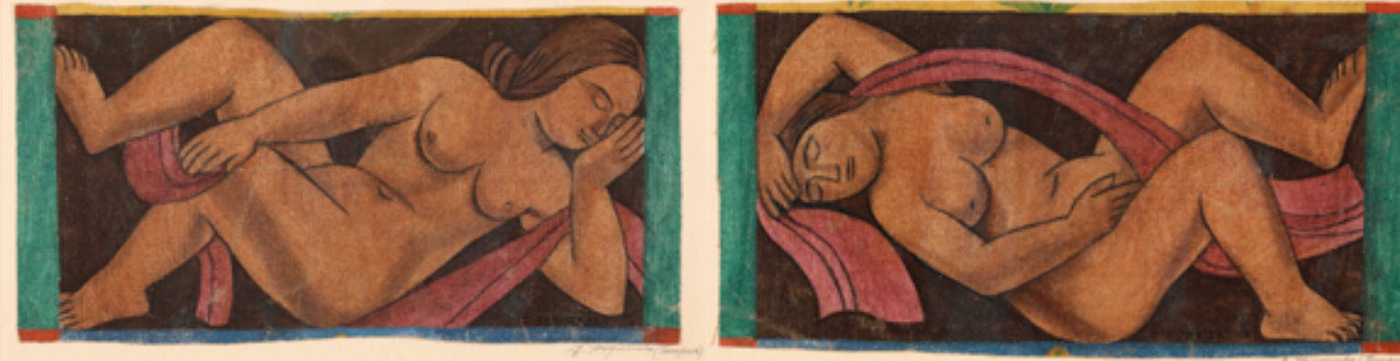
Akty – fragmenty bordiury obrazu Lipiec – sierpień, 1924–1925. (Dekoracja Pawilonu polskiego na wystawie Sztuki Dekoracyjnej i Przemysłu Współczesnego w Paryżu), gwasz i kazeina na płótnie. Kolekcja prywatna

Po wojnie Stryjeńska przebywała na emigracji w Paryżu i Genewie. Najciekawszymi pracami z tego okresu są kompozycje religijne o indywidualnej, niepowtarzalnej ikonografii.