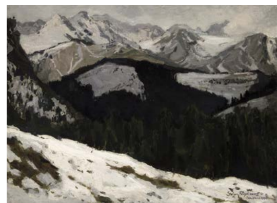
S. Filipkiewicz, Odwilż w Tatrach , 1904