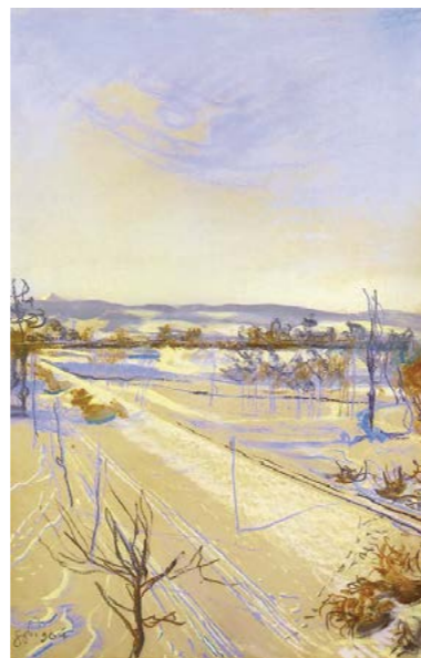
S. Wyspiański, Widok z okna pracowni na Kopiec Kościuszki , 1904