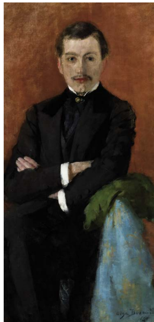
O. Boznańska, Portret Józefa Czajkowskiego , 1892