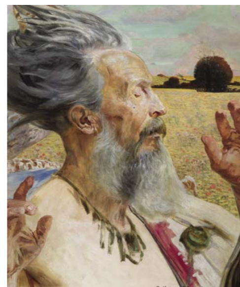
J. Malczewski, Derwid , 1902