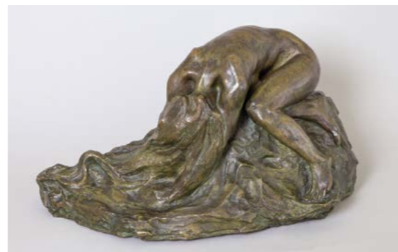
K. Laszczka, Zrozpaczona , 1902