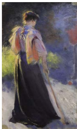
L. Wyczółkowski, Studium do Gry w krokietu (Postać kobieca) , 1892