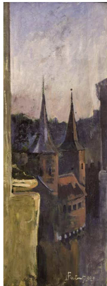
J. Fałat, Fragment Barbakanu , 1909