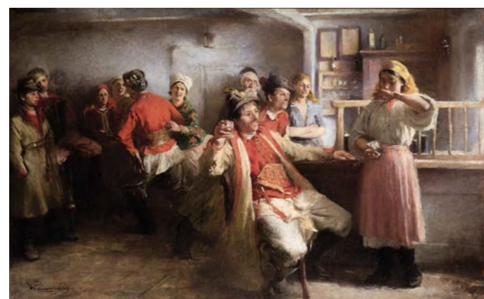
W. Tetmajer, Zaloty , 1894