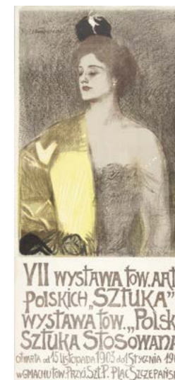
T. Axentowicz, VII Wystawa Towarzystwa Artystów Polskich „Sztuka” (plakat), 1904