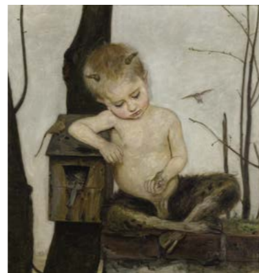
V. Hofman, Wiosna , 1918

Impresjonizm w obrazach Podkowińskiego i Wyczółkowskiego, secesyjna kreska w pastelach Wyspiańskiego i rzeźbach Laszczki, przeziębione melancholią portrety Boznańskiej, chłopomania Tetmajera, „oddychające” nastrojem pejzaże Stanisławskiego... A tuż obok – symbolizm narodowy w dziełach Malczewskiego, próba uchwycenia polskości w stylu zakopiańskim przez Witkiewicza, krytyka dekadentkich postaw w „Weselu” i wykpiwanie ich w karykaturze czy piosenkach i wierszykach kabaretu „Zielony Balonik”. Młoda Polska to wiele więcej niż tendencje kształtujące europejski modernizm, czyli: idea wyzwolenia sztuki, jaskrawy indywidualizm, bunt wobec świata filistrów i mieszczańskiej moralności, odejście od realizmu i naturalizmu, nakierowanie ku podświadomości i temu, co nadprzyrodzone. Młoda Polska to wciąż trwający, wielki, romantyczny spór o „sprawę polską” i pozostającą w niewoli Rzeczypospolitej. Dlatego portret tej wyjątkowej epoki, zamykającej się między 1890 a 1918 rokiem, to za mało. Potrzebny jest portret podwójny. Zapraszamy do zwiedzania wystawy „Młoda Polska” i uzupełniania – z pomocą „Młodopolskiego słownika pojęć” – niniejszej karty o terminy, nazwiska i miejsca, które pozwolą uchwycić podwójny wymiar polskich zjawisk artystycznych tego czasu.