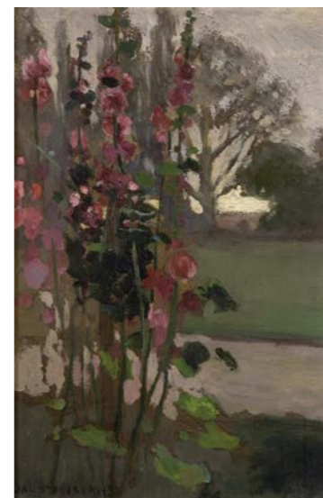
J. Stanisławski, Malwy – polska jesień , 1900