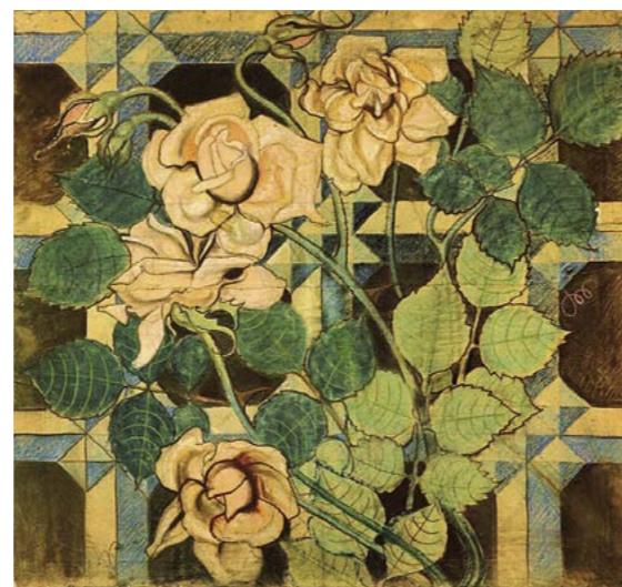
S. Wyspiański, Róże , fragment projektu polichromii dla kościoła franciszkanów w Krakowie