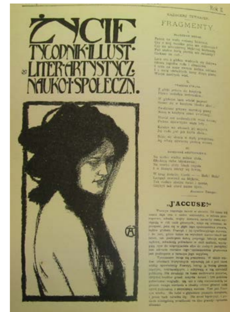
Pierwsza strona czasopisma „Życie” ze stycznia 1898 roku