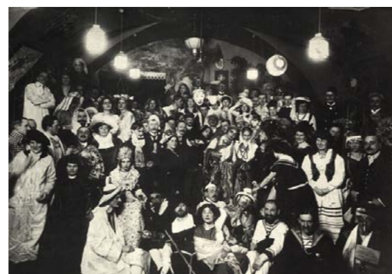
Szopka „Zielonego Balonika”, wnętrze „Jamy Michalika”