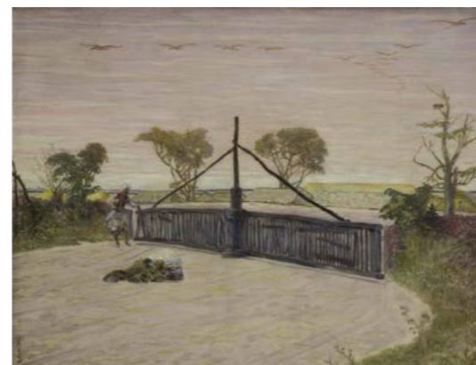
J. Malczewski, Anhelli , 1918