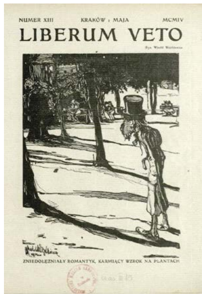
Okładka czasopisma Liberum veto z maja 1904 roku