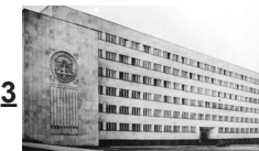
3 Gmach Urzędów Niezaspólnych w Katowicach, pl. Sejmu Śląskiego 1, 1935-1937