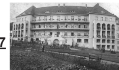
17 Jastrzębie Zdrój – Sanatorium dla Inwalidów Wojennych, ul. Kościuszki 14, 1927-1928 r.