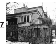
7 Cieszyn – Willa Elizy Niemcowej, ul. Miarki 2, 1932-1933 r.