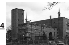
4 Chorzów – Kościół Św. Antoniego, ul. Kopernika 1, 1930-1934 r.