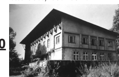
10 Górk Wielkie – Stacja Harcerska, ul. Stary Dwór, 1935-1938 r.