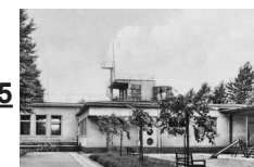
15 Katowice – przedszkole z ogrodem jordanowskim, ul. św. Barbary 25, 1937-1938 r.