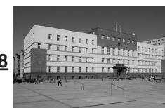
8 Ruda Śląska – Ratusz Nowego Bytomia, pl. Wolności 6, 1928-1929 r.