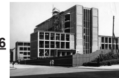
16 Katowice – Muzeum Śląskie, ul. Henryka Dąbrowskiego, 1935-1936 r.