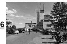
6 Bielsko-Biała – Lotnisko w Aleksandrowicach ul. Cieszyńska 321; 1934-1936 r.