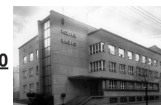
20 Katowice – Gmach Polskiego Radia Katowice, ul. Juliusza Ligonia 29, 1937-1938 r.