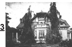
13 Bystra Śląska – Sanatorium Przeciwgruźlicze, ul. Fałata 2, 1936 r.