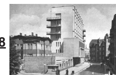
18 Katowice – Dom Powstańca, ul. Jana Matejki 3, 1936-1937 r.