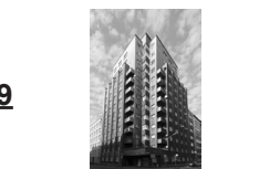
19 Katowice – Wieżowiec u zbiegu ul. Żwirki i Wigury 15-17, 1929-1930 r.