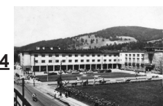
14 Wisła – Dom zdrojowy ul. Hoffa 3, 1935-1937 r.