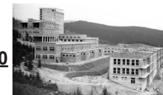
10 Istebna – Wojewódzki Zakład Lecznico-Wychowawczy im. J. Piłsudskiego, Istebna 500, 1930-1937 r.