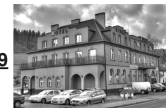
9 Ustroń – Pensjonat Czantoria, ul. 3 Maja 99; [data nieznana]