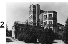
2 Wisła – Zameczek prezydenta RP, ul. Zameczek 1, 1929-1931 r.