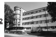
12 Piekary Śląskie – Gimnazjum Państwowe, ul. Gimnazjalna 24, 1932 r.