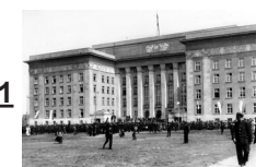
21 Katowice – Urząd Wojewódzki i Sejm Śląski, ul. Jagiellońska 25, 1924-1927 r.