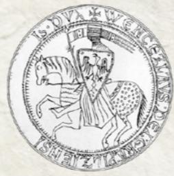
Pieczęć Waclawa II