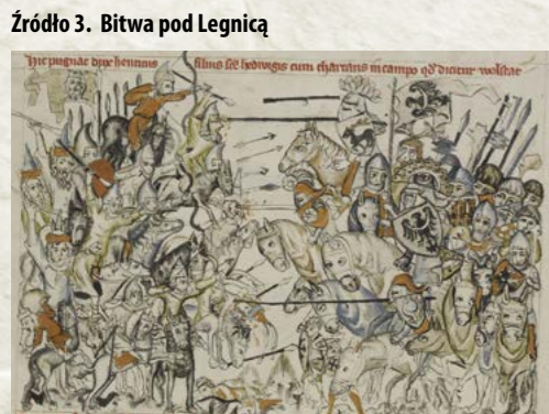
Bitwa pod Legnicą, Vita beatae Hedwigis, Silesian, 1353

Źródło 2. Kronika Wielkopolska [fragment] W roku zaś Pańskim 1241 chan Tatarów Batu wraz ze swymi wojskami [...], ludu srogiego i niezliczonego, przeszedł przez Ruś, chciał wkroczyć na Węgry. Lecz zanim dotarł do granic Węgrów, część swego wojska skierował przeciw Polsce. W Popielec spustoszyli oni miasto i ziemię sandomierską, nie oszczędzając ani płci, ani wieku. Potem przez Wiślicę przeszli do Krakowa, szerząc spustoszenie. [...] I tak [...] część wojska Tatarów, pustosząc kolejno Sieradz, Łęczycę i Kujawy, przyszła aż na Śląsk. Henryk [Henryk II Pobożny], syn Henryka Brodatego, książę Śląska, Krakowa i Wielkopolski, potężnie zabiegał im drogę z wieloma tysiącami zbrojnych na polu zamkowym w Legnicy i odważnie walczył z nimi, pokładając nadzieję i ufność w pomocy Boga. Lecz zrzuceniem Boga, który niekiedy z powodu zbrodni zezwala na biczowanie swoich, wspomniany szlachetny książę Henryk, straciwszy wiele tysięcy ludzi, sam poległ zabity. Kronika wielkopolska – anonimowa kronika opisująca dzieje średniowiecznej Polski (od czasów legendarnych aż po rok 1273) napisana w łacinie średniowiecznej w końcu XIII lub w XIV wieku. Kronika była pisana z punktu widzenia i z perspektywy Wielkopolan.