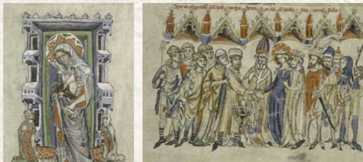
Ślub Henryka Brodatego z Jadwigą, Vita beatae Hedwigis Silesian 1353, the J. Paul Getty Museum

Zadanie 3. Na podstawie źródeł pochodzących z Legendy obrazkowej o św. Jadwidze (wykonanej w 1353 r. na zamówienie księcia Ludwika I, władcy Brzegu nad Odrą) wyjaśnij: