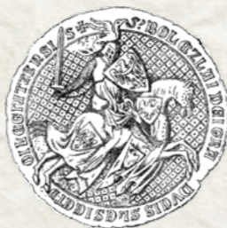
Pieczęć Bolesława III Rozrzutnego