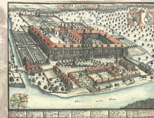
Opactwo cystersów w Lubiążu północno-zachodniej; przedstawienie z XVIII wieku

Śląsk na przełomie XII i XIII w. W 1201 r. Mieszko Płatonogi zaczął tytułować się niezależnym księciem opolsko-raciborskim (zapoczątkował tym samym linię Piastów opolskich), podczas gdy Bolesław i jego syn – Henryk Brodaty nosili tytuł książąt Śląska. Warto jednak zwrócić uwagę na postać Bolesława Wysokiego , który jako pierwszy próbował zaszczerpić na Śląsku szerzej pojętą kulturę europejską, z którą miał okazję obcować na wielu placówkach (pobyt w otoczeniu cesarza Fryderyka Barbarossa, towarzyszenie mu w wyprawach do Italii, wreszcie pochodzenie – po kądzieli – z znaczącego rodu Babenbergów). Swoje doświadczenia i kulturowe horyzonty widać w inicjatywach, jakie podejmował na Śląsku. Pod koniec XII w.