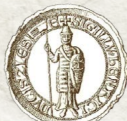
Pieczęć Henryka Brodatego