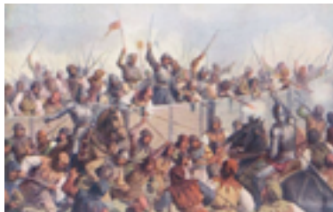
Josef Mathauer, Bitwa pod Lipanami (obraz z pocz. XX w.)