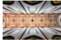
Kościół św. Mikołaja w Brzegu, wnętrze.