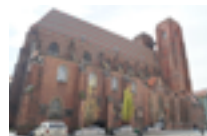
Kościół św. Marii Magdaleny we Wrocławiu