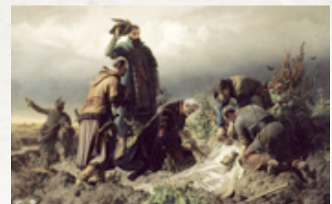
Odnalezienie ciała Ludwika II Jagiellończyka. Obraz Bertalana Székely'ego z 1860 r.

Reformy Macieja Korwina kontynuował od roku 1490 jego następca na tronie czeskim i węgierskim – Władysław Jagiellończyk. W 1498 r. wydatnie wzmocnił on rolę zgromadzeń śląskich. W tzw. śląskiej Karcie Swobod potwierdził wszystkie stare przywileje i wolności książąt oraz stanów. Władysław, zasiadając na tronie czeskim, prowadził na Śląsku politykę dynastyczną w interesie Jagiellonów. W 1491 roku ofiarował księstwo glogowskie swemu młodszemu bratu – Janowi Olbrachtowi, a po nim kolejnemu bratu – Zygmuntovi. Zygmunta (późniejszy król Polski, Zygmunta Stary) wzmocnił swą pozycję poprzez wykup ziemi opawskiej z rąk Jana Korwina (pozamałżeńskiego syna Macieja). W 1494 roku w ręce polskie przeszło też księstwo zatorskie. Dziesięć lat później Zygmunta został mianowany nadstarostą śląskim. Zasłużył się jako dobry gospodarz: uporządkował bicie monety, tępił nekające Śląsk zbójnictwo. Zręczność polityki najmłodszego Jagiellona uwidoczniła się w umiejętności łagodzenia konfliktów wewnętrznych na Śląsku oraz systematycznym wprowadzaniu prawa pisanego. Podjęte przez niego w 1506 roku starania o koronę polską przerwały działalność Zygmunta na Śląsku. (por.: www.eduś.pl )