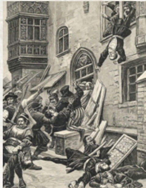
Defenestracja wrocławska

Kolejne najazdy husyckie na Śląsku miały za cel opanowanie całego regionu przez Prokopa Wielkiego. Wyprawy były coraz lepiej przygotowane pod względem militarnym, co powodowało, że tylko tak wielkie miasta jak Wrocław zdołały odeprzeć atak. Podbita została m.in. Niemcza, gdzie działał jeden z najbardziej zagorzałych husytów śląskich – Piotr Polak, zwany Żłodzijskim Krukiem. Podobnie za sprawą księcia Zygmunta Korybutowicza zajęte przez niego Gliwice stały się ważnym ośrodkiem husytów na Śląsku i bazą wypadową dla ich rejz. W 1431 r. stojący na czele koalicji antyhusyckiej książę oleśnicki Konrad Biały odbił Gliwice, gdzie w efekcie doszło do rzezi starszyny husyckiej. Dalsze działania odwetowe husytów przyniosły z kolei rozboje i rabunki posiadłości klasztornych w Henrykowie, Krzeszowie,