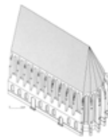
Kościół św. Jakuba i św. Agnieszki w Nysie

Zadanie 5. Na podstawie poniższych grafik i ilustracji scharakteryzuj styl gotycki w architekturze średniowiecznej