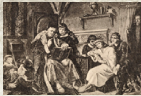
Jan Długosz naucza synów króla Kazimierza IV Jagiellończyka, rycina z XIX w.