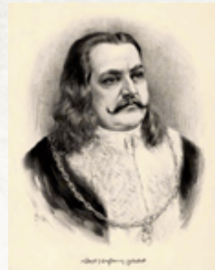
Jerzy z Podiebradów – król Czech w latach 1458–1471. Był pierwszym w historii królem państwa europejskiego, który odrzucił wiarę rzymskokatolicką i przyjął nauki Jana Husa

Przywódca narodowego ugrupowania husyckiego, Jerzy z Podiebradów, w 1458 r. objął tron w Pradze. Niektóre miasta śląskie, a także większość książąt odmówiła złożenia mu hołdu, upatrując w nowym władcy przede wszystkim heretyka. Stolica Apostolska nie była z kolei jednoznaczna w swym podejściu, ponieważ czeskie siły były znaczącą częścią w planowanej przez Piusa II kolejnej krucjacie antytureckiej. Sytuację zmieniła odmowa uczestnictwa Jerzego z Podiebradów w tej inicjatywie. W efekcie papież ogłosił krucjatę antypodiebracką, do której przystąpiła większość książąt śląskich i nieomal od razu poniosła klęskę (bitwy pod Żąbkowicami i Kożuchowem, 1467 r.). W Królestwie Czech trwała tymczasem wewnętrzna rywalizacja o tron, na którym część możnowładców chętniej widziałaby władcę katolickiego. Takim królem mógł być Maciej Korwin – ówczesny monarcha węgierski. 3 maja 1469 r. został on w Otomuńcu obwołany królem czeskim. Za tym wyborem poszła większość książąt śląskich, która kolejno złożyła władcy hołd. Ten czeski „rozłam” u władzy zakończył się w 1471 r. nagłą śmiercią Jerzego z Podiebradów. Zgodnie z wcześniejszą umową sukcesyjną władzę w królestwie Czech objął syn króla polskiego – Władysław