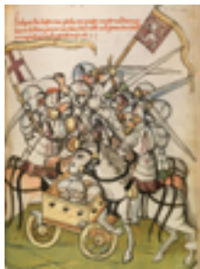
Bitwa pod Chrastawą (również bitwa pod Kratzau); źródło: domena publiczna