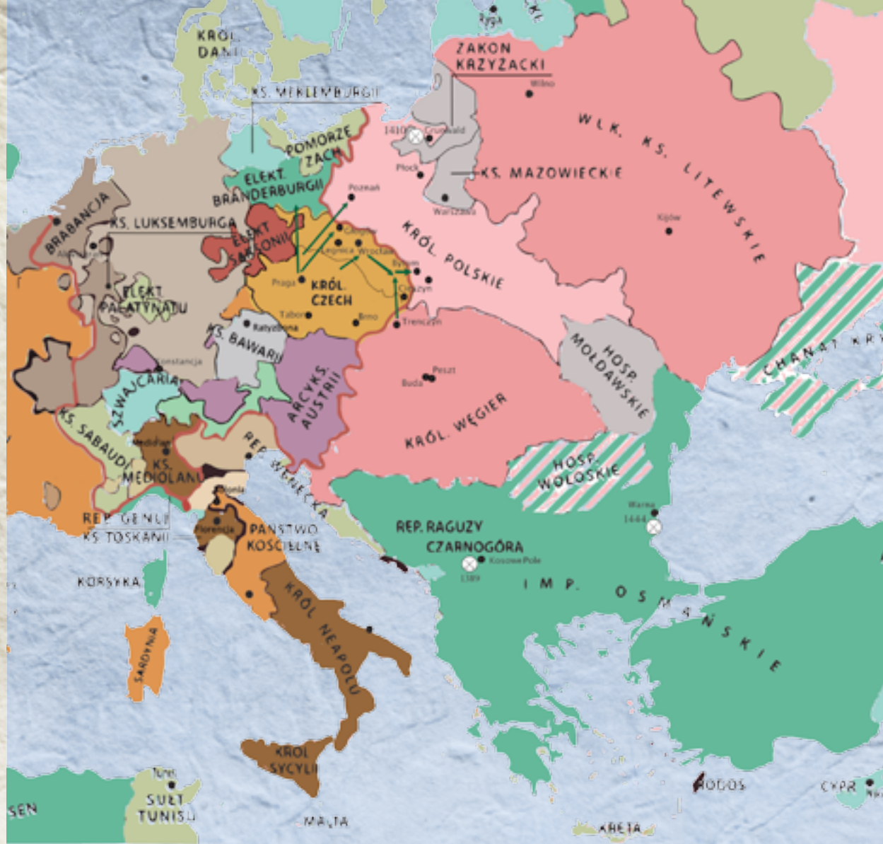
Europa w XV w.