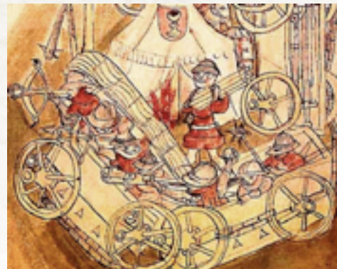
Tabor husycki

Sam czeski husyizm był nie tylko programem reformy Kościoła. Zawierał w sobie także hasła narodowe i społeczne, z którymi sympatyzowały głównie warstwy niższego mieszczaństwa,