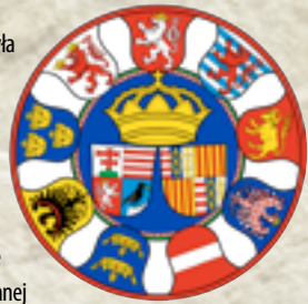
Tarcza herbowa Macieja Korwina

W 1515 r. zawarto układ dynastyczny pomiędzy Jagiellonami a Habsburgami (tzw. śluby wiedeńskie), który w przypadku wygaśnięcia jagiellońskiej linii czesko-węgierskiej otwierał Habsburgom drogę do rządów w Królestwie Czech. Po śmierci Władysława II Jagiellończyka rządy w Czechach i na Węgrzech przejął jego syn Ludwik II Jagiellończyk, który