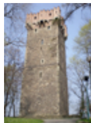
Wieża Piastowska w Cieszyźnie